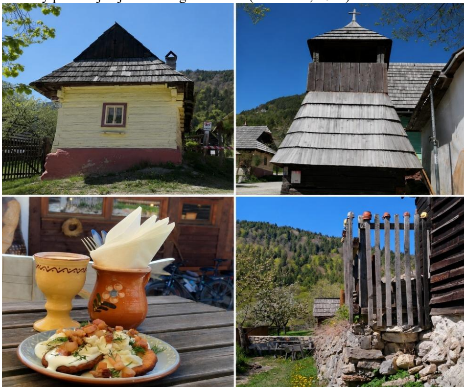
Obrázok 2 Obec Vlkolíнец

Zachovanie nemateriálneho kultúrneho dedičstva na Liptove si vyžaduje systémový prístup, ktorý zahŕňa podporu folklórnych súborov, remeselných dielní, komunitných iniciatív a edukačných projektov. Mnohé z týchto aktivít sú realizované v spolupráci s občianskymi združeniami, múzeami a školami. Významnú úlohu zohráva aj digitalizácia a popularizácia dedičstva prostredníctvom sociálnych médií, čím sa tieto hodnoty približujú aj mladším generáciám (Zaušková, 2022).